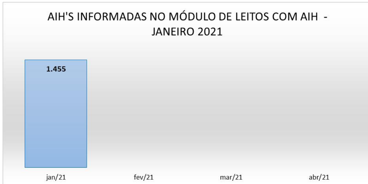
Gráfico 1: Total de internações gerais informadas na CROSS em até 24 horas no mês de janeiro/21: