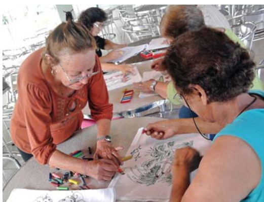
Participantes do primeiro grupo do projeto fizeram pintura a giz de cera em panos de prato

Após a exposição dos panos de prato, foi definido que o próximo bazar de artesanato, em data ainda