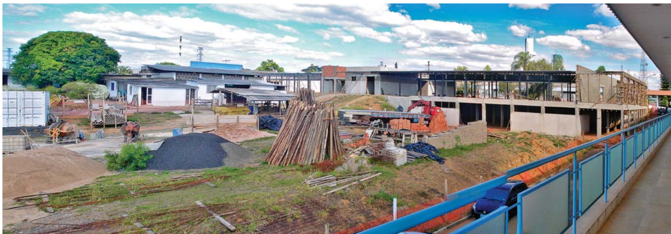
Pavilhão de Internação construído ao lado do Hospital do Câncer de Franca: expectativa é que obras sejam concluídas ainda este ano

AS OBRAS NO NOVO PAVILHÃO DE INTERNAÇÃO do Complexo Hospitalar Santa Casa, em espaço anexo ao Hospital do Coração e Hospital do Câncer, seguem a todo vapor. Com ajuda da população, de empresários e do Poder Público o andamento é bom e o prédio deve ser entregue no início do próximo ano.