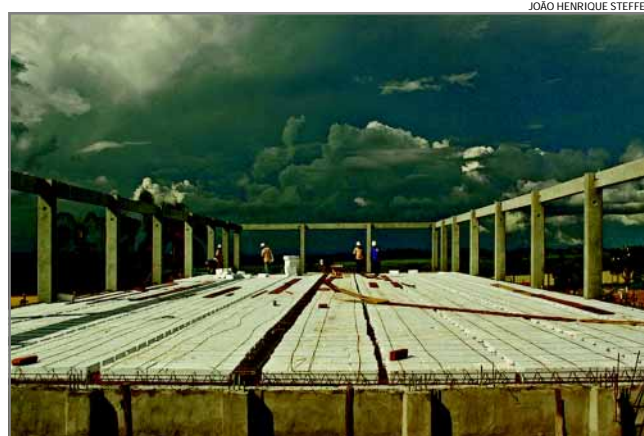
Vista do piso superior da ampliação, que terá uma ala exclusiva para atendimento infanto-juvenil