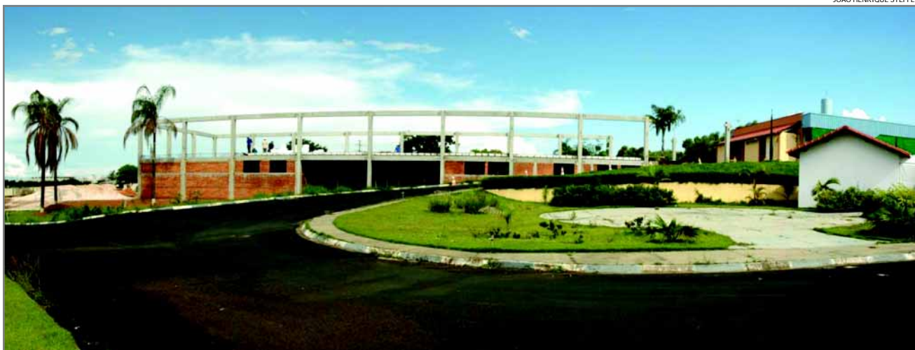
Imagem panorâmica das obras de ampliação do hospital. Uma conquista da população de Franca e região, com a ajuda de empresários, instituições e grupos da comunidade.