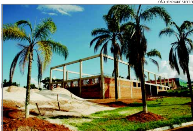
Visão em perspectiva das obras de ampliação do Hospital do Câncer de Franca