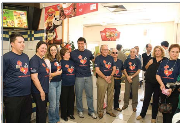
Diretoria do Hospital do Câncer, equipe dos Voluntários da Saúde e, proprietários e funcionários do McDonalds reunidos no McDia Feliz 2008. Sucesso de arrecadação!

Este ano foram vendidos 4.020 vales antecipados de Big Mac, cerca de 4.700 camisetas, e mais a doação dos padrinhos Leite Zanetti e Consórcio Luiza no valor de R$ 4 mil. O restaurante McDonalds da avenida Major Nicácio ficou aberto 24 horas para atender a todos e nos dois locais (Avenida e Franca Shopping), os funcionários e voluntários trabalharam para garantir o sucesso da arrecadação. No ano que vem, tem mais!!!