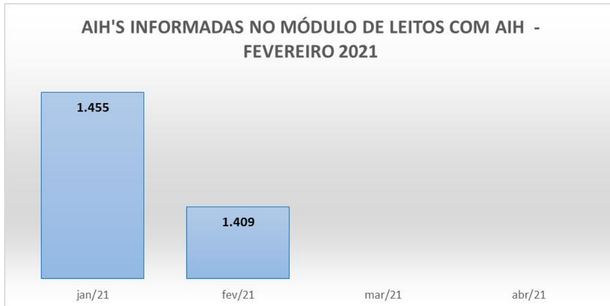
Gráfico 1: Total de internações gerais informadas na CROSS em até 24 horas no mês de fevereiro/21: