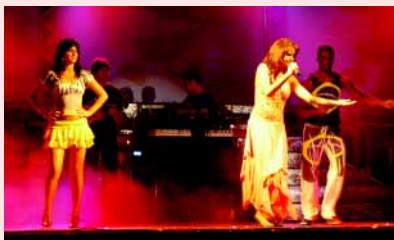
Banda Conexão Nacional: madrinha do evento

A organização do evento, que contou com a animação da Banda Conexão Nacional, colaborou para o sucesso da promoção que bateu recorde de público, arrecadando R$ 28.950 mil.