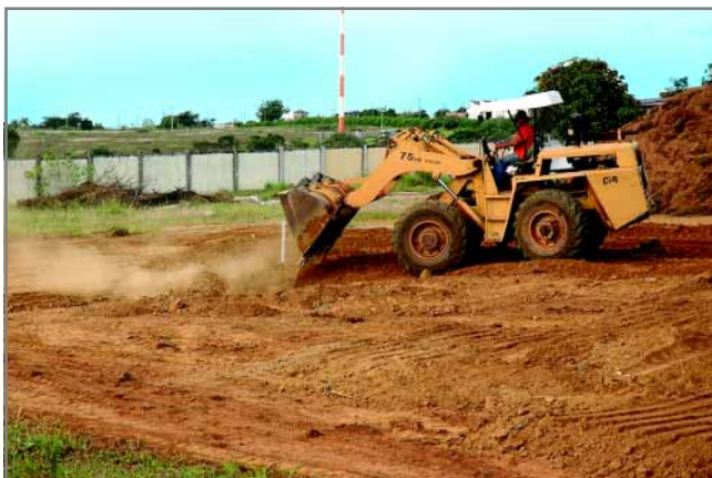
Início da obra, com o serviço de terraplenagem, preparando a área para a fundação

Para participar da obra (com dinheiro ou material de construção), as empresas podem entrar em contato com Laura, no Telemarketing, ligando para (16) 3722 4000.