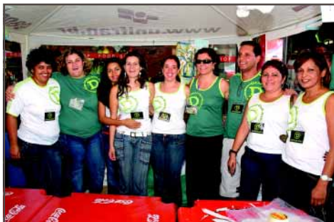
Integrantes do Telemarketing do HC e colaboradores da Santa Casa reunidos