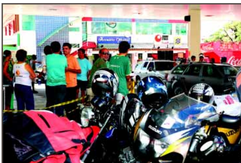
Intenso movimento no Posto Galo Branco: colaboração maciça e sucesso de arrecadação