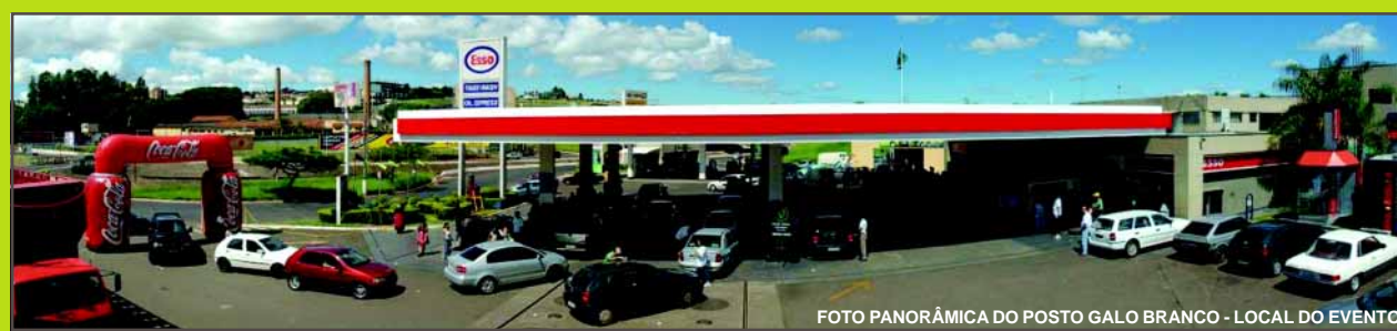
FOTO PANORÂMICA DO POSTO GALO BRANCO - LOCAL DO EVENTO