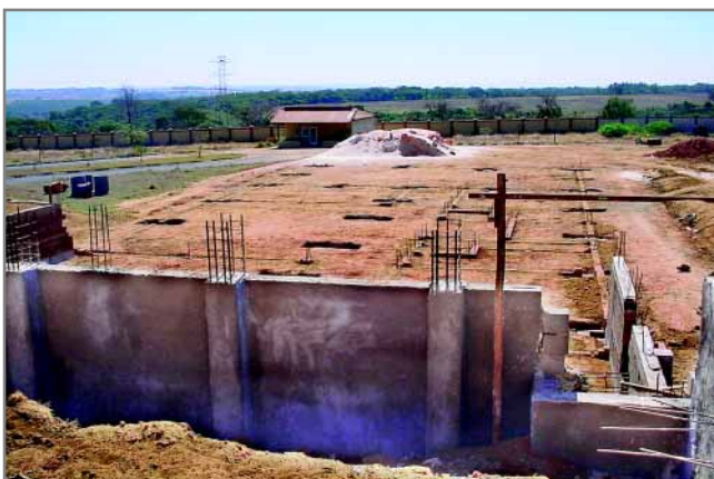
Muro de arrimo em primeiro plano e terreno com a preparação para colocação dos pilares