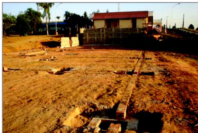
Ao fundo, muro de arrimo em construção e obras de fundação e colocação de pilares