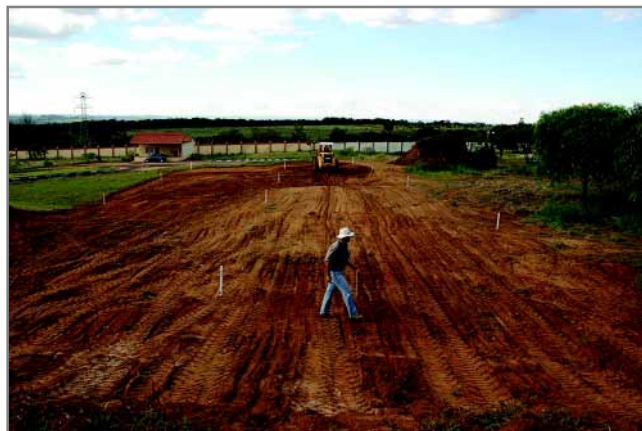
Acima, visão geral do terreno antes do início da obra