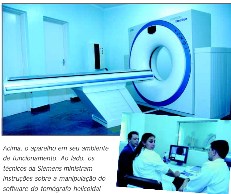
Acima, o aparelho em seu ambiente de funcionamento. Ao lado, os técnicos da Siemens ministram instruções sobre a manipulação do software do tomógrafo helicoidal

O Tomógrafo Helicoidal permite realizar diagnósticos de corpo inteiro, com tecnologia de rotação contínua e aplicação em radioterapia e braquiterapia. Possui um sistema de raios laser que localiza com precisão os pontos de tumores e repassa a informação para o computador instalado na radioterapia, que por sua vez ajusta o acelerador nuclear diretamente no tumor que receberá o tratamento.