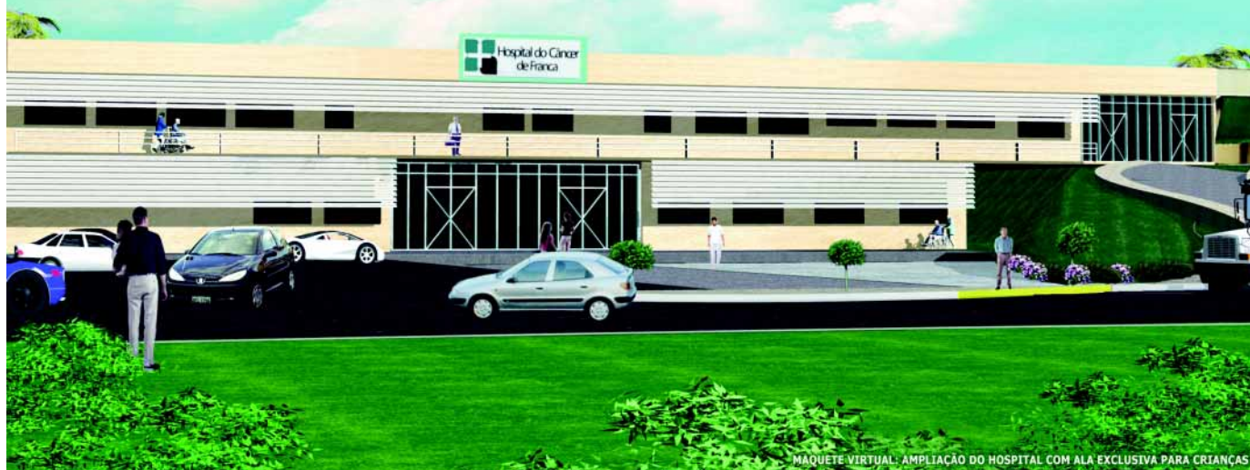
MAQUETE VIRTUAL: AMPLIAÇÃO DO HOSPITAL COM ALA EXCLUSIVA PARA CRIANÇAS

Ampliação do Hospital do Câncer começa a tornar-se realidade!