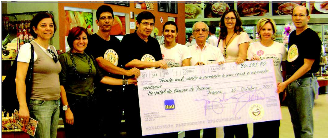
Representantes do hospital recebem o cheque do valor arrecadado das mãos dos proprietários da Padaria Estrela

A segunda edição da campanha "Estrela Solidária", realizada no dia 09 de outubro, pela Padaria Estrela foi um sucesso de público e de arrecadação. Mais de 3 mil pessoas passaram pelas duas lojas da empresa (Major Nicácio e Jardim Redentor), proporcionando um faturamento total, de R$ 30.191,90 para o Hospital do Câncer (incluindo a venda de produtos, camisetas e assinaturas de Jornal). Este resultado é 50% maior que a 1ª edição realizada em outubro de 2006.